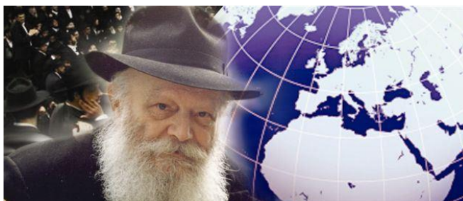
Ребе Шнеерсон Менахем Мендл

В Интернете можно ознакомиться с «Планами относительно славян» , высказанными не кем иным как самим «мошиахом 1992 года» - ребе Менахем-Менделем Шнеерсоном: