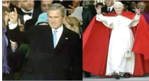
Рогатая рука – знак Сатаны.

См. источник: «О последних судьбах мира» Свята Гора Афон 2014 г. с.17.